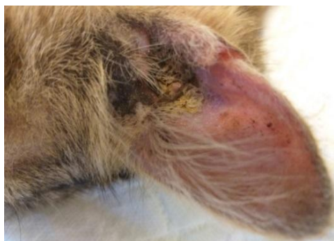
Рис. 2. Струпья и корки в слуховом проходе. Pic. 2. Scabs and crusts in the ear canal.

Лабораторная диагностика. Для постановки диагноза и дифференциации от других заболеваний (воспаление ушной раковины, бешенство, энцефалит) было проведено микроскопическое исследование. Данное исследование представляет собой обнаружение чесоточных клещей в содержимом ушного прохода. Материал для исследования брали ватными палочками и посредством соскоба свежих чесоточных очагов (с двух–трех мест) на границе пораженной и здоровой кожи.