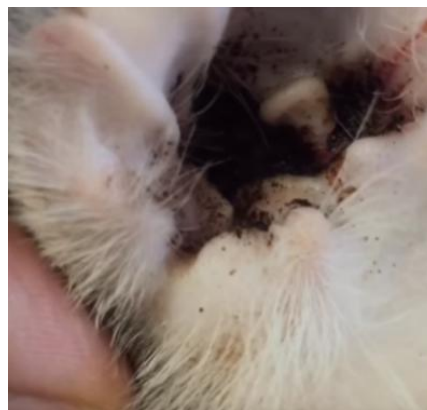
Рис. 1. Клиническая картина заболевания – отодектоз (экссудат в ушном проходе у кошки).

Такие клинические признаки могут указывать на разные патологии как инфекционного, так и не-